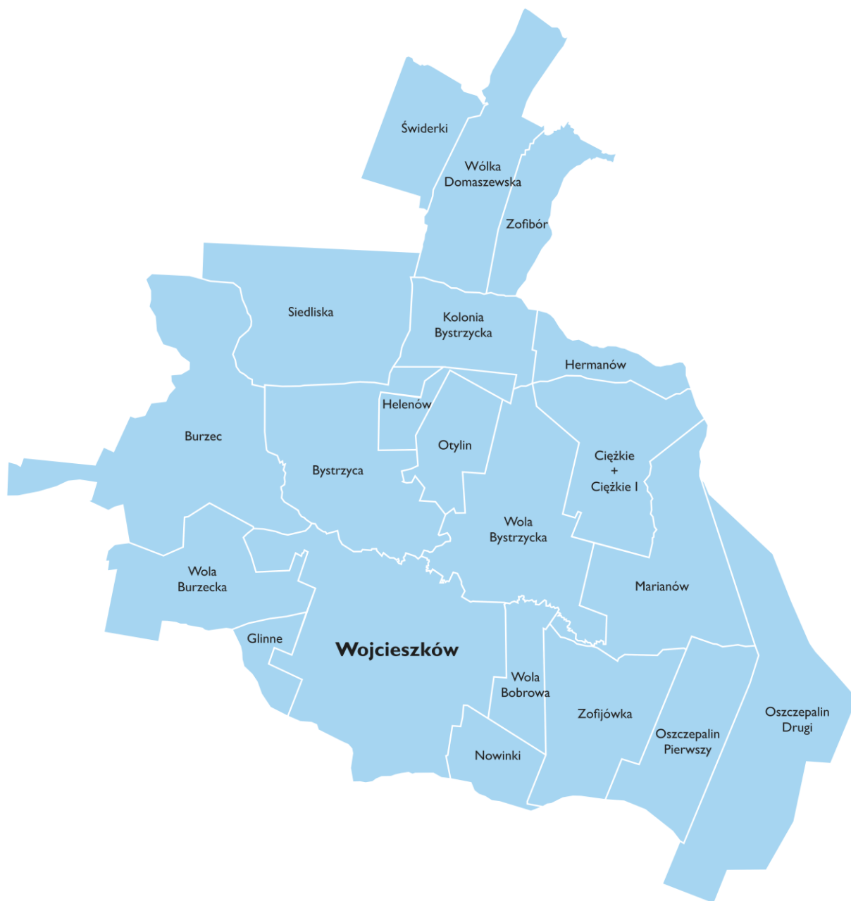
Rysunek 2. Mapa jednostek analitycznych (sołectw) gminy Wojcieszków.