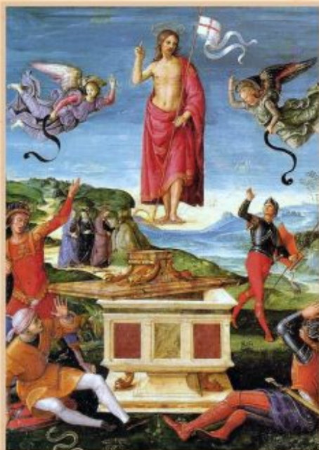
Rafaël Santi, Zmartwychwstanie Chrystusa, 1502, obraz olejny na desce, Museu de Arte de São Paulo